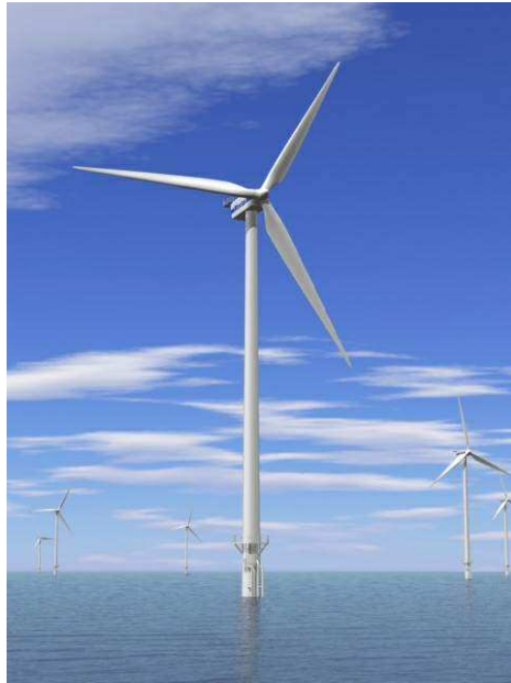
Geplaatste windturbine (voorbeeld)

In de volgende secties worden de uitvoeringsmethoden nader toegelicht.