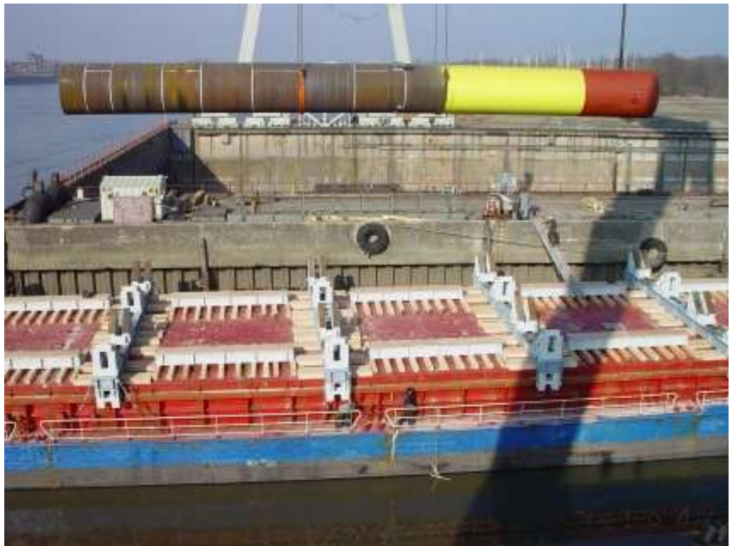
Laden van een funderingspaal op een transportschip (voorbeeld)