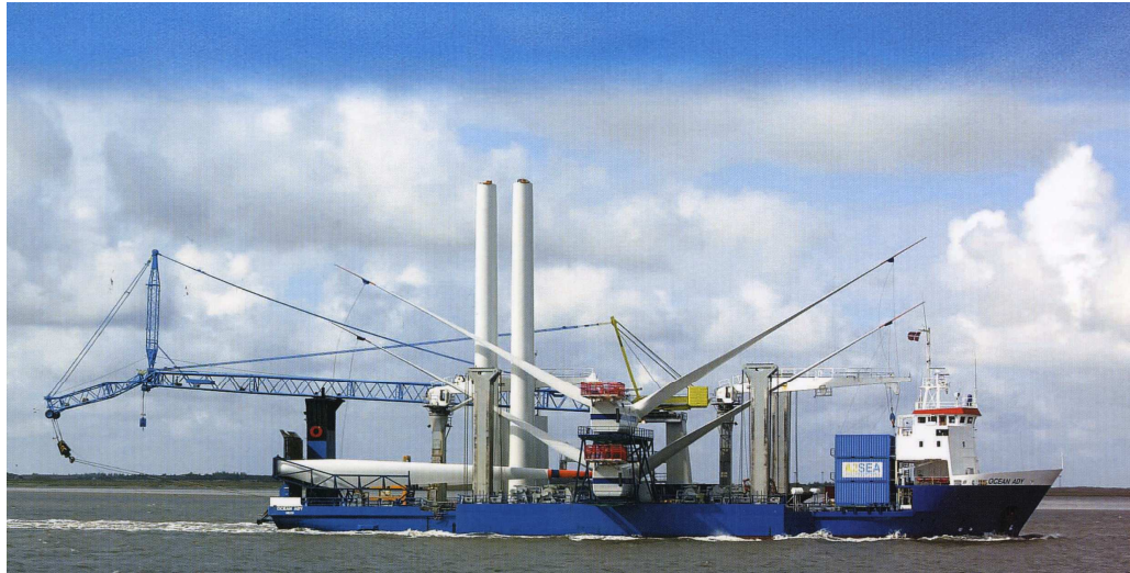
Hefschip voor offshore installatie (voorbeeld)

Voor het verwijderen van de windturbines wordt gebruik gemaakt van een hefschip met een hijsinstallatie, dat zich ten opzichte van de zeebodem kan fixeren.