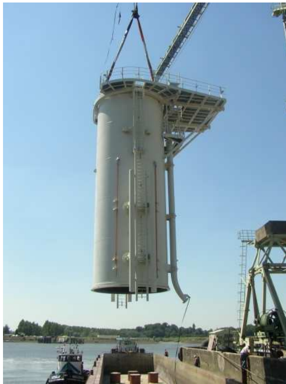
Transitiedeel offshore windturbine (voorbeeld)